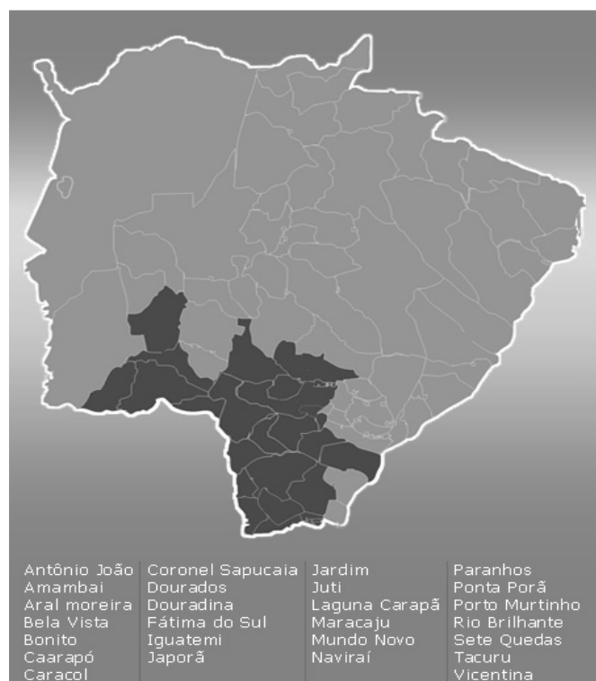
Figura 1 – Municípios abrangidos pela área objeto de estudo visando à demarcação de áreas indígenas

A região indicada, segundo dados do Instituto Brasileiro de Geografia e Estatística – IBGE, referentes à estimativa populacional de 2007, concentra 635.491 habitantes, o que equivale a 28% de toda a população estimada para Mato Grosso do Sul no mesmo ano.